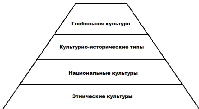
Схема 1. Культурная пирамида

Поскольку этническая культура целиком погружается в национальную, а последняя не всегда полностью включается в соответствующий культурно-исторический тип, дальнейшее рассмотрение структуры мы будем строить на основе национальной культуры. В национальной культуре можно выделить четыре сегмента и записать их в виде уравнения вида: Культура = Доминирующая культура + Субкультура + Контркультура + Антикультура. Три последних элемента уравнения не имеют четко выраженной, постоянной структуры. Их структура, как правило, фрагментарна и в высокой степени изменчива. Доминирующая культура определяет вектор развития государства и базируется на культурах входящих в него этносов. В культуре этноса мы выделяем ядро культурной общности, которое представлено этническими языками и архетипами, слагающими коллективное бессознательное этноса. Этнические ядра культурной общности формируют ядро национальной культуры, которое также представлено языками и архетипами. В исторических координатах времени ядра различных уровней иерархии возникают и формируются со значительным интервалом. Первыми формируются этнические архетипы и язык. Их возникновение можно отнести к доисторическому периоду, ко времени перехода от процессов природных к процессам культурным. Начало